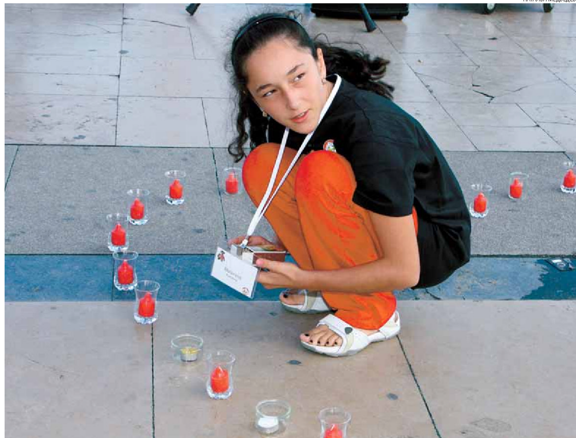
Дети Беслана зажигают свечи на Площади прав человека в Париже

Эти мальчики и девочки, сбившиеся в кучку на парижской площади с символическим названием «Площадь прав человека», похожи на миллионы своих сверстников. Они могут говорить о видах, открывающемся перед ними городе, о прошедшем визите, о средневековом замке, где они остановились, о футбольном матче, сыгранном во время их пребывания в летнем лагере, о подарках, о погоде, о поездке в Диснейленд и еще о тысяче вещей, о которых говорят подростки между